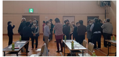
ぐータッチで交流